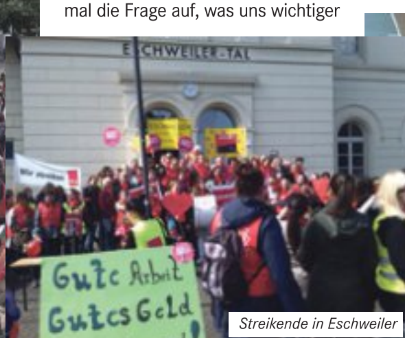
Streikende in Eschweiler