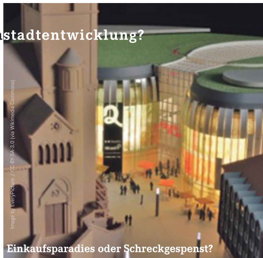
Einkaufsparadies oder Schreckgespenst?