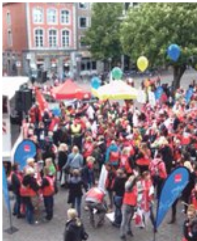
Große Kundgebung vor dem Aachener Rathaus

Wahlkreisbüro Andrej Hunko, MdB Südstraße 53/55, 52064 Aachen Telefon 0241 / 990 682-50 Telefax 0241 / 990 682-51 E-Mail: andrej.hunko.wk@bundestag.de www.andrej-hunko.de Sprechzeiten: Montags 13 bis 15 Uhr, Donnerstags 17 bis 19 Uhr und nach Vereinbarung Sozialsprechstunde Bundestagsbüro Andrej Hunko Jeden 2. und 4. Mittwoch im Monat ab 17.00 Uhr