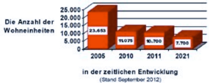
Öffentlich geförderter Wohnraum in Aachen

immer mehr Menschen in unserem reichen Land von Armut betroffen sind. Die Gründe für die zunehmende Armut sind vielfältig (Arbeitslosigkeit, Arbeit im Niedriglohnsektor und/oder Leiharbeit, Hartz IV, Renten von denen Menschen nicht leben können, u.v.a.m.) und doch allesamt das traurige Ergebnis einer ‚Politik der sozialen Kälte‘, die mit der „Ära Schröder“** (Ex-Bundeskanzler / SPD) ihren Anfang nahm und seither die Schere zwischen Arm und Reich immer weiter auseinander treibt. Besonders betroffen sind dabei Familien mit Kindern, Alleinerziehende, Migranten/innen, ältere Personen und Menschen mit Handicap.